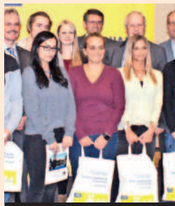
Stolze neue Besitzer.