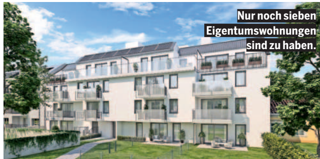
Nur noch sieben Eigentumswohnungen sind zu haben.

Grün. Im liebevoll gestalteten Garten stehen großzügige Gemeinschaftsflächen mit Outdoorküche, gemütlichem Sitzplatz sowie Gartengerätehäuschen zur Verfügung. Hochbeete wurden aufgestellt, die den Wohnungseigentümern kostenlos zur persönlichen Nutzung zur Verfügung stehen. In kleinem Rahmen wird so Naturerfahrung in der Stadt, direkt vor Ihrer Wohnung, möglich. Sonnentanken können Sie auch auf der großen Gemeinschafts-